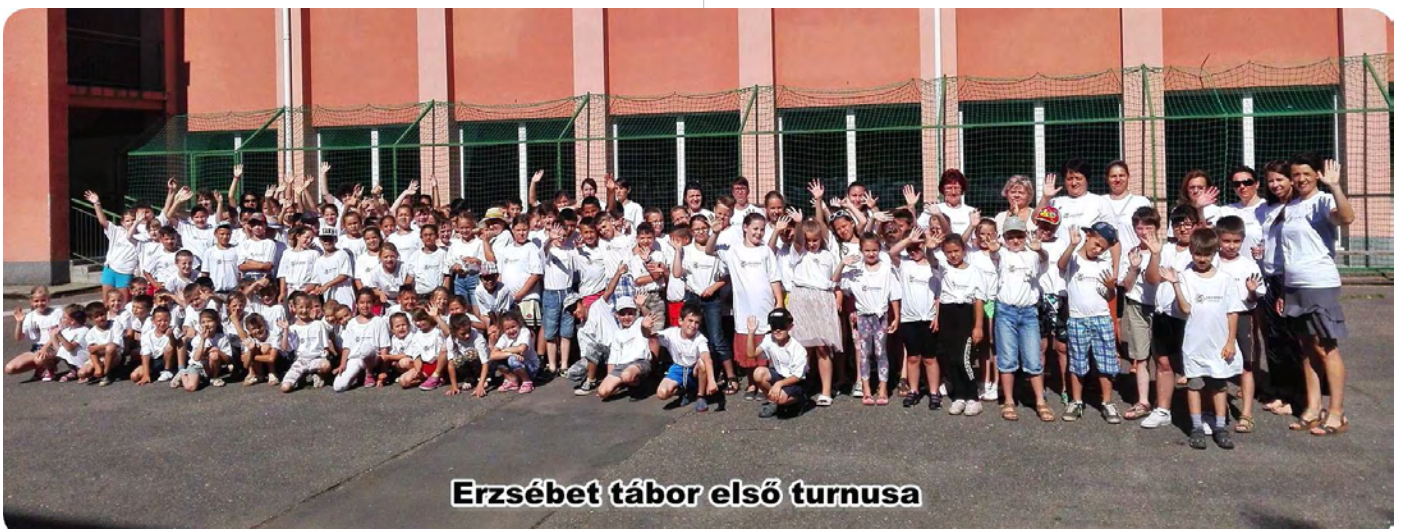
Erzsébet tábor első turnusa